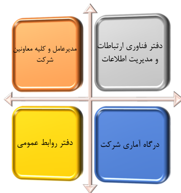
شکل ۱: مجراهای آماری مورد تایید شرکت برق منطقه‌ای غرب جهت انتشار آمار و اطلاعات

۴-۲-۱- حوزه‌های شرکت برق منطقه‌ای غرب فقط از طریق مجاری زیر می‌توانند نسبت به انتشار " آمارهای رسمی " اقدام نمایند و هرگونه اشاعه اطلاعات آماری توسط سایر مسئولین غیرمرتبط، فاقد ارزش اعتباری و استنادی است.